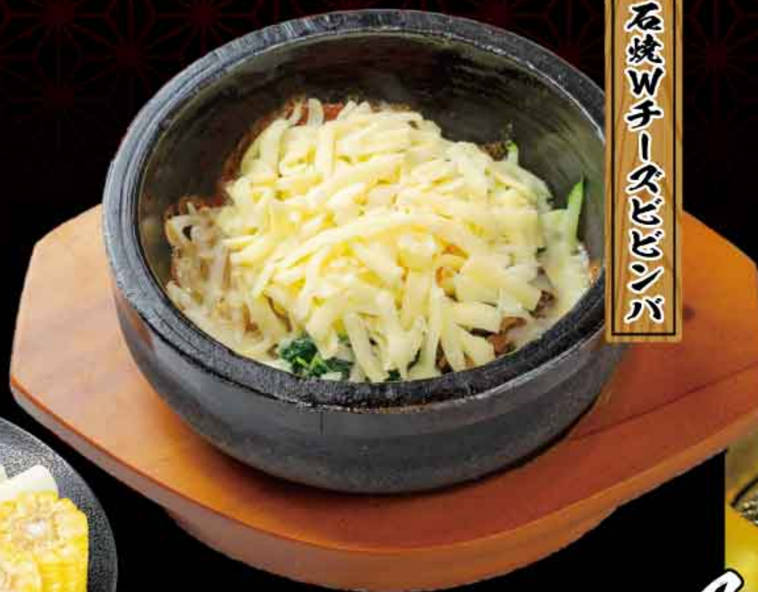
石焼Wチーズビビンバ