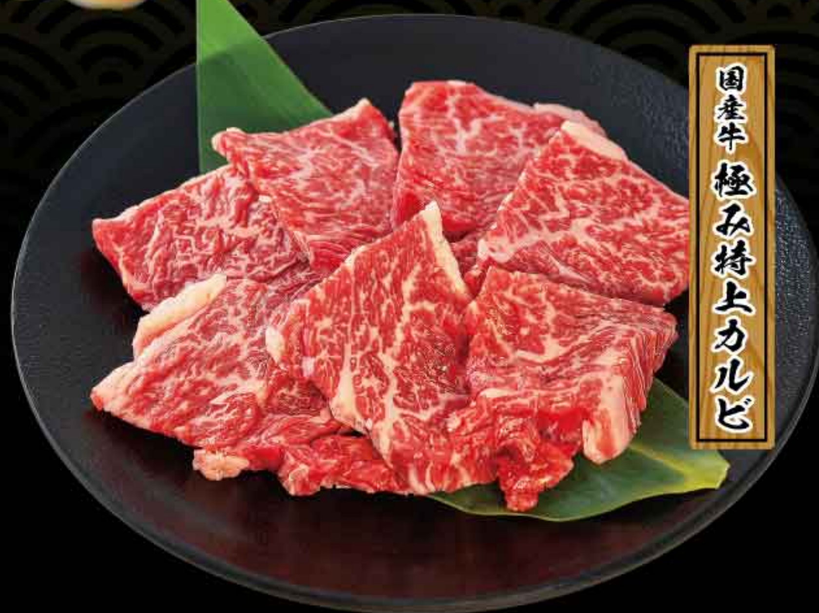
国産牛極み特上カルビ