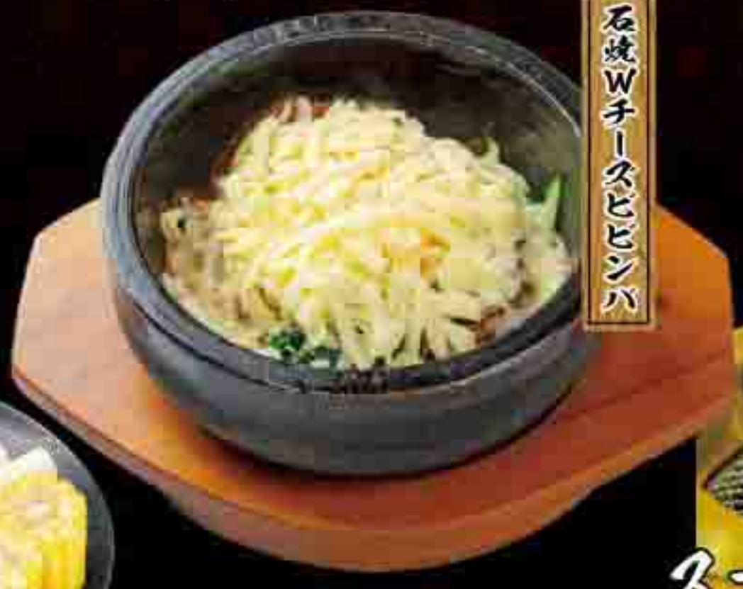
石焼Wチーズビビンバ