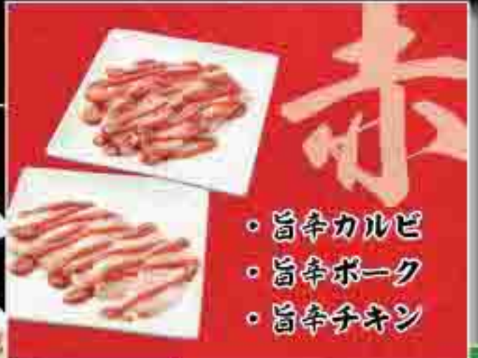
赤胡椒カルビ 赤胡椒ポーク 赤胡椒チキン