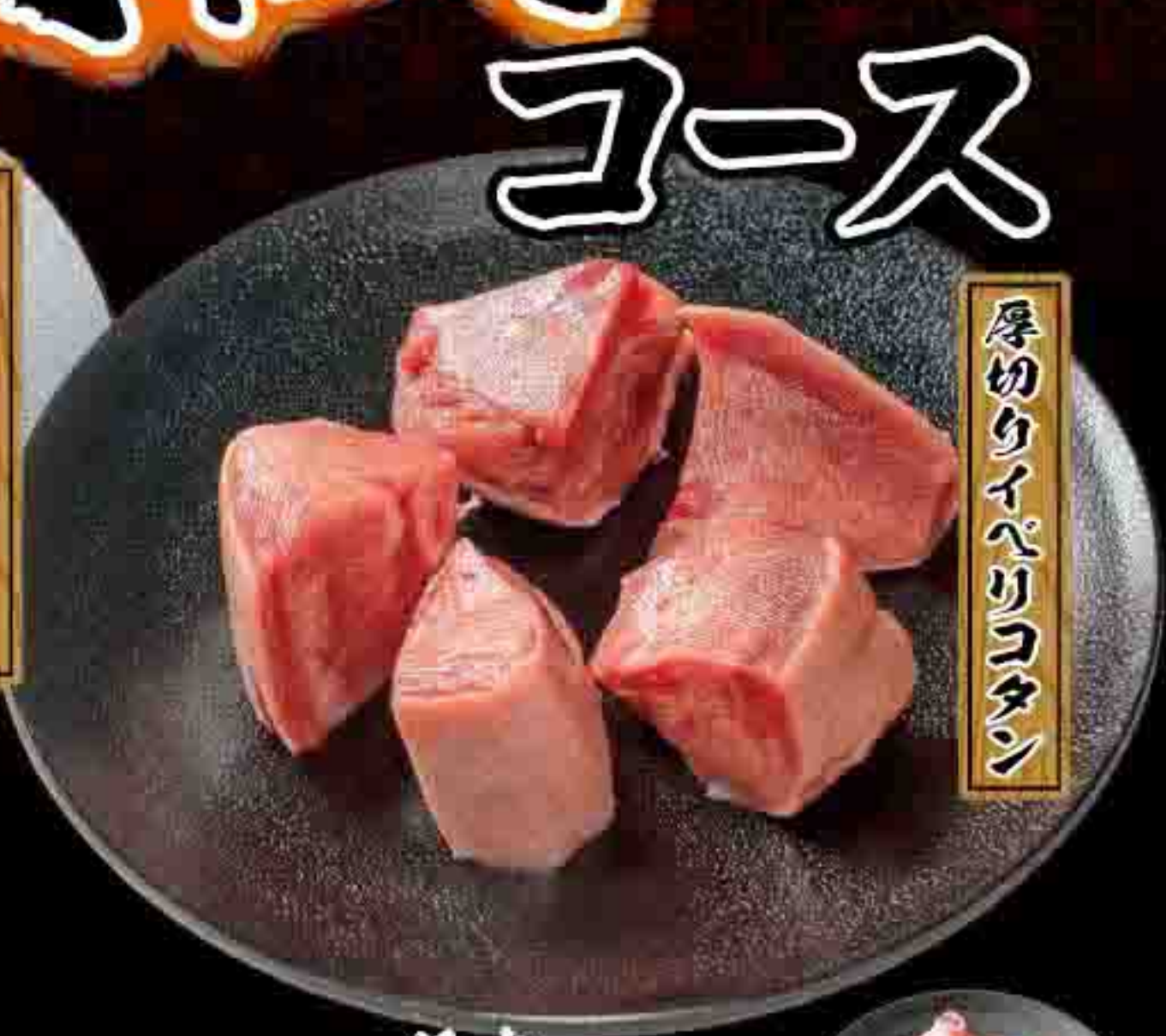
厚切りイベリコタン