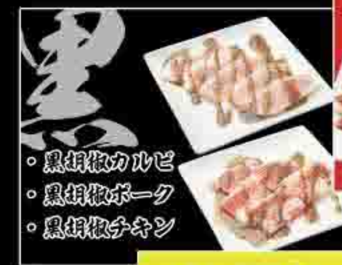
黒胡椒カルビ 黒胡椒ポーク 黒胡椒チキン