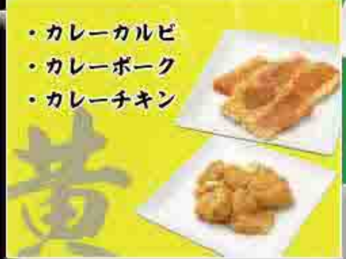
カレーカルビ カレーポーク カレーチキン