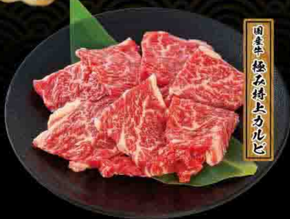
国産牛極み特上カルビ