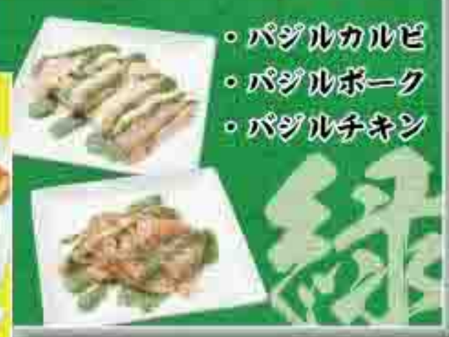
パジルカルビ パジルポーク パジルチキン