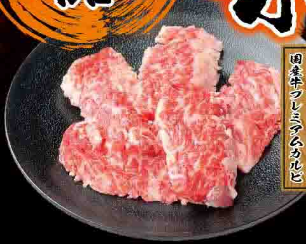
国産牛プレミアムカルビ